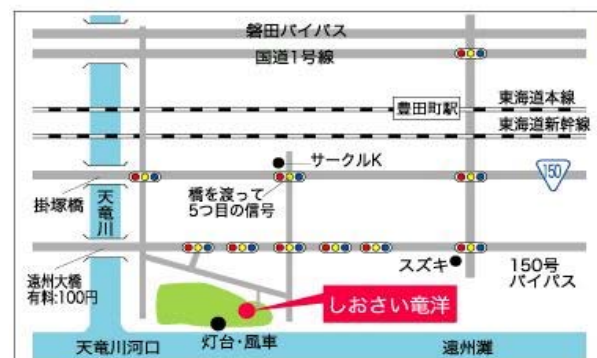
磐田市竜洋海洋公園案内図

お問い合わせ先 (社)磐田青年会議所 〒438-0078 静岡県磐田市中泉281-1 TEL: 0538-37-1616 FAX: 0538-37-6351 ※電話でのお問い合わせは平日(水曜除く9:00~15:00)のみ E-mail: iwata-jc@inh.co.jp